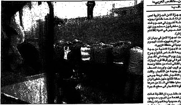
الاجساد المتناثرة تتهدد باستمرار في الجزائر لكن التحق وتواصل بعض الضحايا